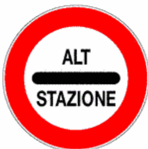
Figura II 99 Art. 123

Indica l'obbligo di arresto ad un posto di blocco stradale istituito dagli organi di Polizia.