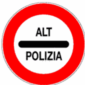
Figura II 98 Art. 123

Il segnale Fig. II 97/a, integrato dal pannello modello II 1, presegna la frontiera di stato con paese confinante facente parte della Comunità Europea. Sulle strade extraurbane il pannello integrativo misura 120 x 40 cm. Sulle autostrade misura 150 x 50 cm.