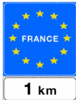
Figura II 97/b Art. 123

Indica la frontiera di Stato con paese confinante facente parte della Comunità Europea. Le quote indicate sono riferite alle strade extraurbane. Sulle autostrade il lato del quadrato è uguale a 150 cm.